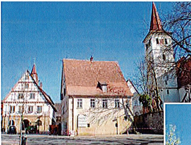
Altes Schulhaus in der Ortsmitte von Altdorf vor der Sanierung im Jahr 2008

ALTDORF ZUR MUSTERKOMMUNE DER STÄDTEBAUFÖRDERUNG GEWÄHLT